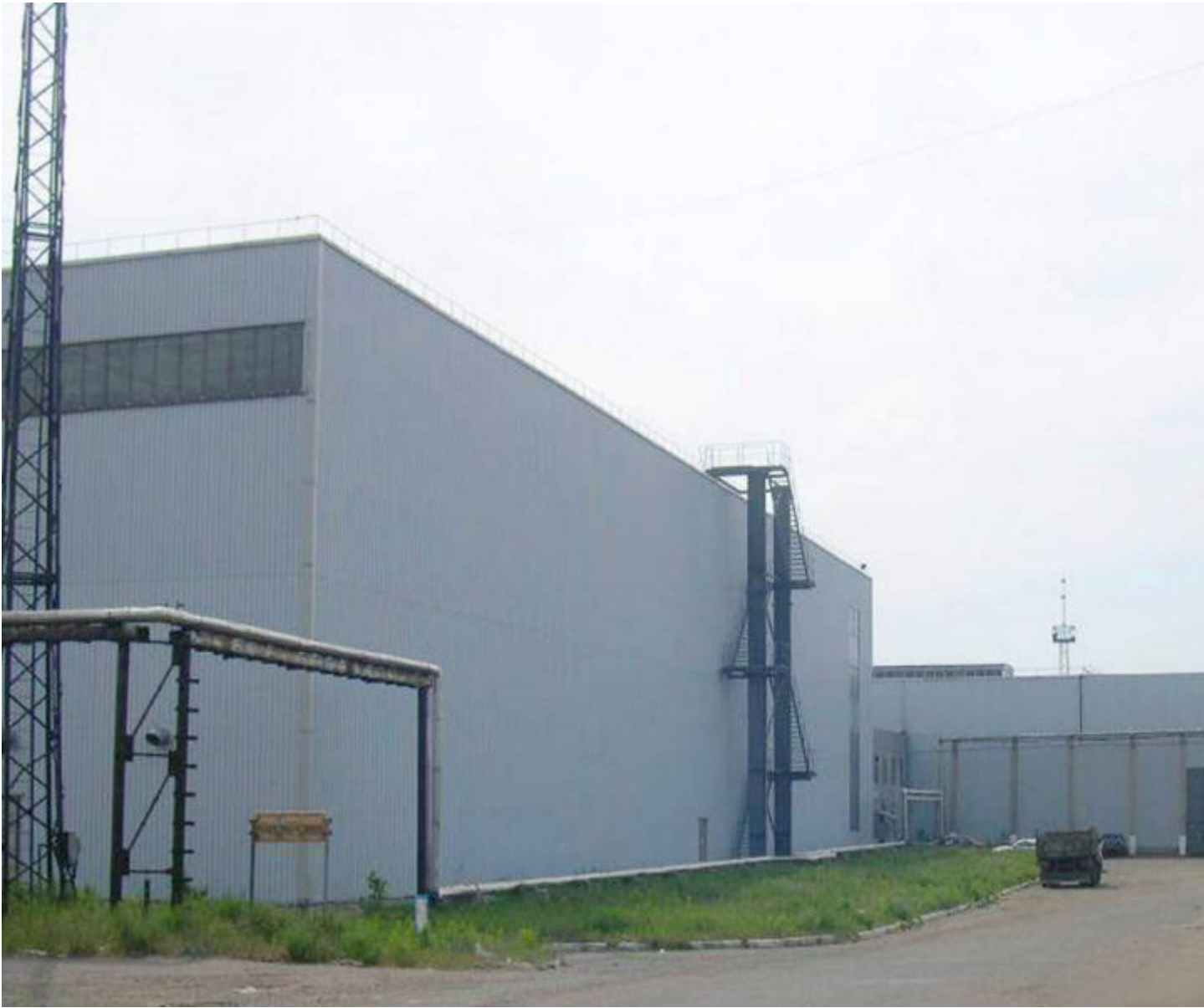
Камера хранения замороженных полуфабрикатов компания РегТайм